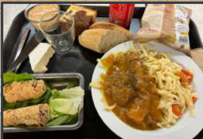
Repas amélioré Asiatique